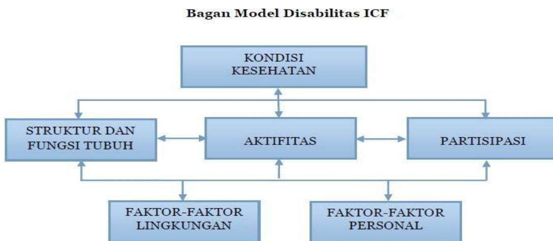
Gambar . Baan Model Disabilitas ICF